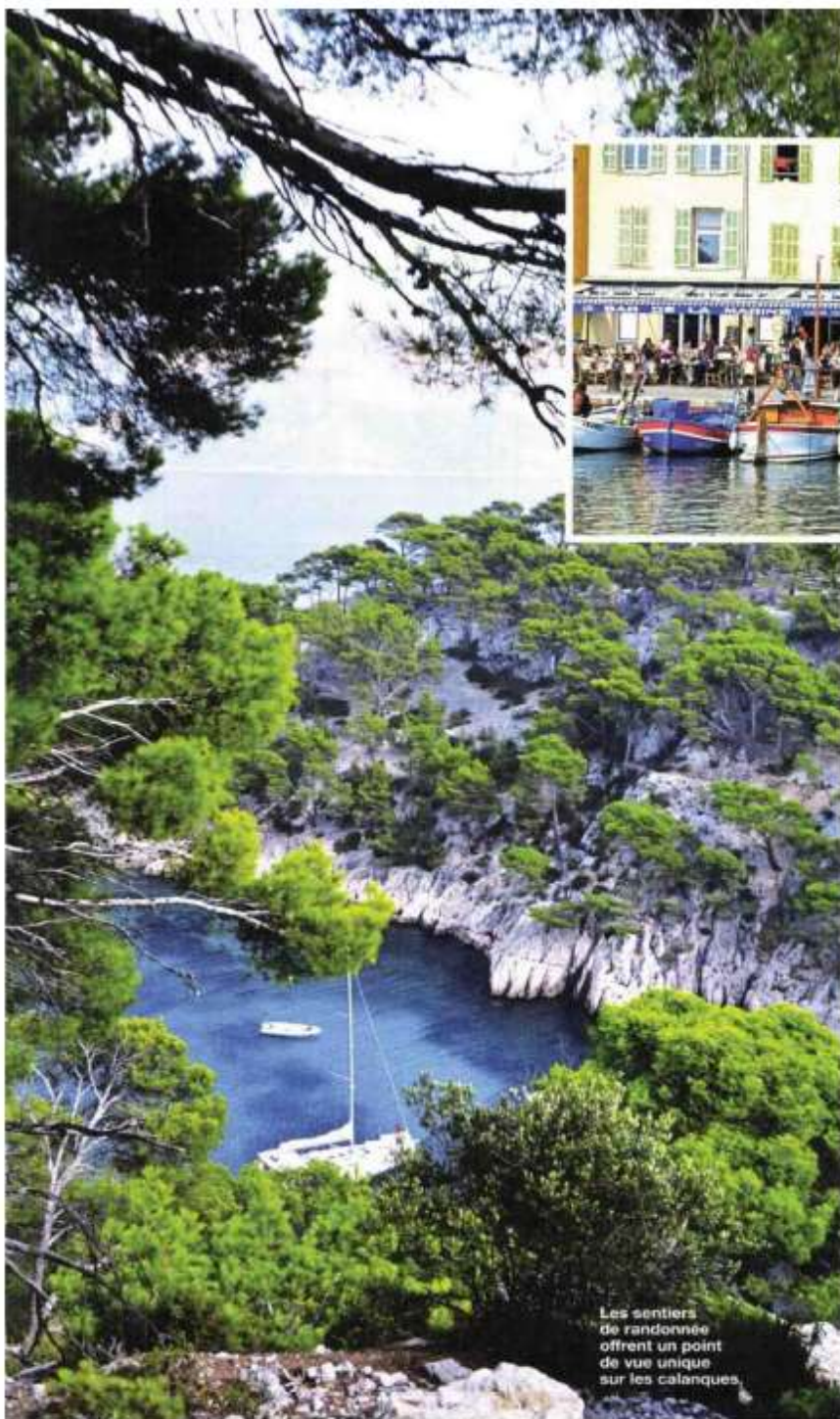
Les terrasses du port de Cassis sont prises d'assaut pour profiter d'un agréable moment.